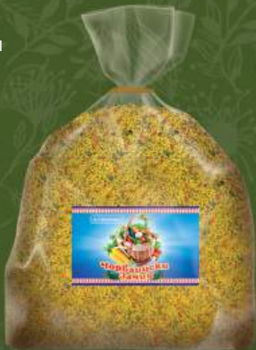
Чорбаџиски зачин 10kg. кеса шифра: 291