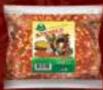
Буковец нелут 60г. 100/1 шифра: 9