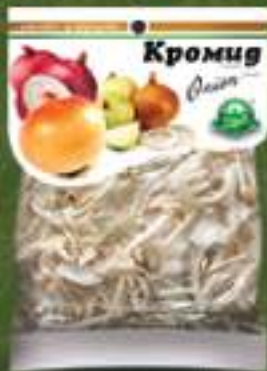
Кромид сув 50г. 10/1 шифра: 19