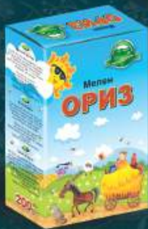
Мелен ориз 200г. 10/1 шифра: 28