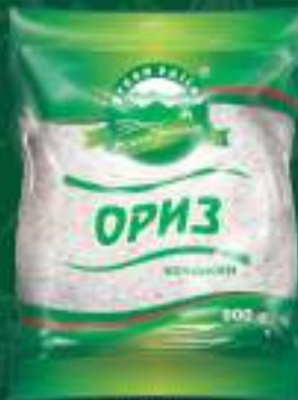
Ориз 900г. 10/1 шифра: 30