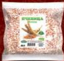
Пченица белица 400г. 35/1 шифра: 158