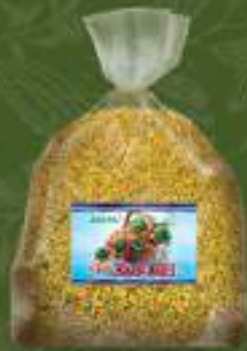
Наш зачин 10кг. кеса шифра: 154