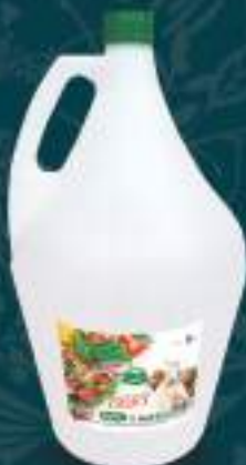
Оцет Прехранбен 3л. 4/1 шифра: 423