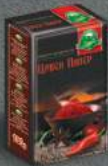
Екстра Црвен Пипер 100г. 10/1 шифра: 47