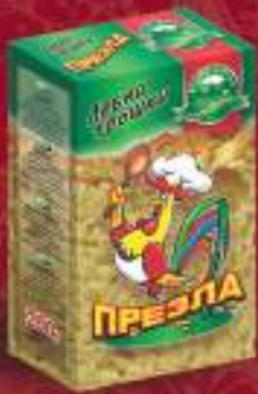
Презла 200г. 10/1 шифра: 34