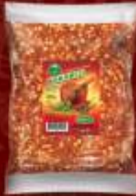
Буковец лут 250г. 30/1 шифра: 853