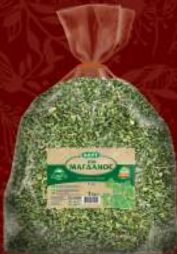
Магдонос 1kg. шифра: 435