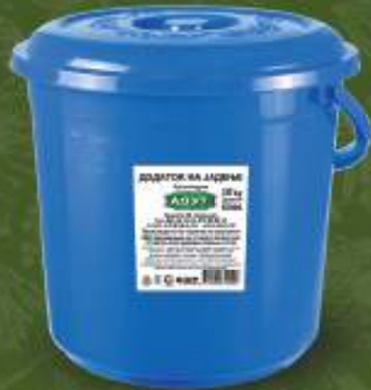
Додаток во јадење 10kg. кофа шифра: 847