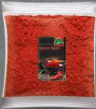
Црвен Пипер 1kg. 10/1 шифра: 882