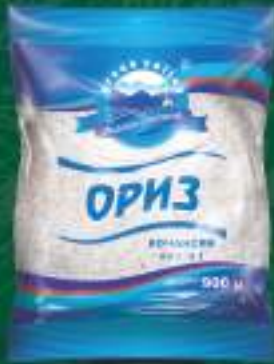
Ориз I-ва класа 900г. 10/1 шифра: 32