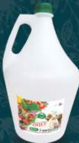
Оцет Прехранбен 5л. 4/1 шифра: 434