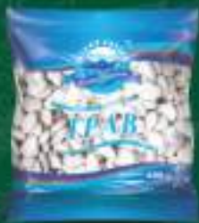
Грав 400г. 10/1