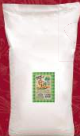
Презла 25кг. шифра: 125