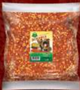
Буковец нелут 1kg. 10/1 шифра: 150