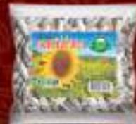
Сончоглед бел 40г. 50/1