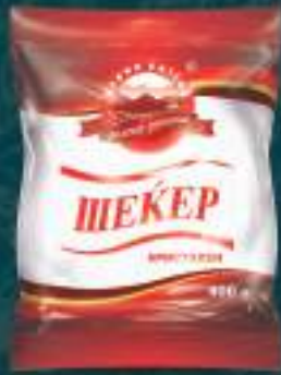
Шеќер 900г. 10/1 шифра: 50