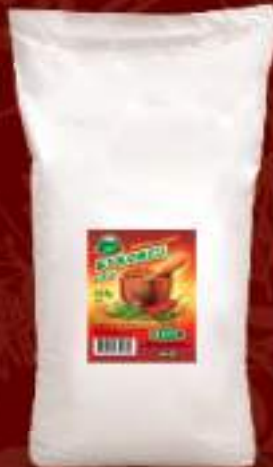
Буковец лут 30kg. шифра: 759