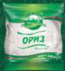
Ориз 400г. 10/1