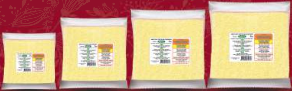
Пире 1кг. шифра: 155