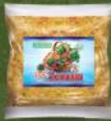
Наш зачин 1кг. 20/1 шифра: 1189