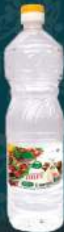
Оцет Прехранбен 1л. 6/1 шифра: 426