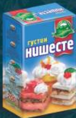
Нишесте/Густин 200г. 10/1 шифра: 26