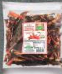
Чили сува пиперка 50г. 25/1 шифра: 1206