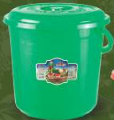
Бид зачин 10кг. кофа шифра: 6