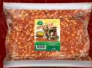
Буковец нелут 500г. 15/1 шифра: 149