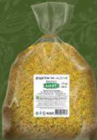
Додаток во јадење 10kg. кеса шифра: 7