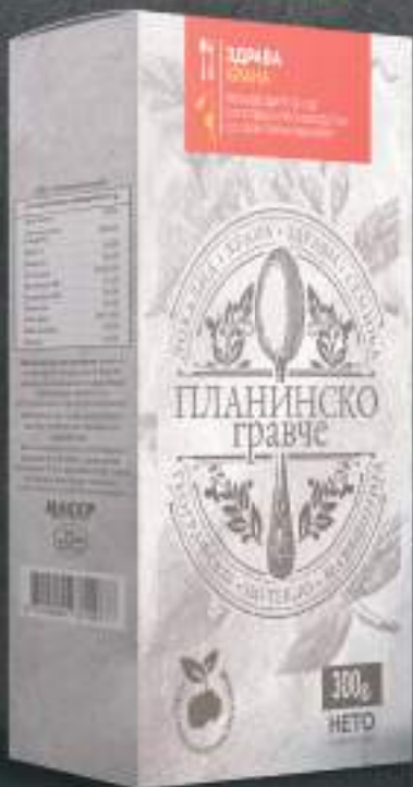
Планинско гравче 300г. 10/1 шифра: 31