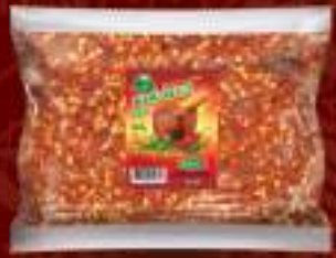
Буковец лут 500г. 15/1 шифра: 764