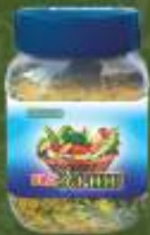
Бид зачин 450г. 12/1 шифра: 3