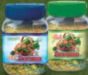
Наш зачин 450г. 12/1 шифра: 160