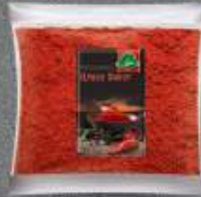
Црвен Пипер 500г. 15/1 шифра: 884