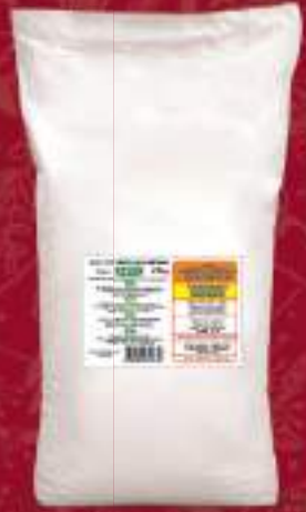
Пире 25кг. шифра: 571