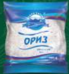
Ориз I-ва класа 400г. 10/1