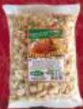
Презла 200г. во коцка 15/1 шифра: 1207