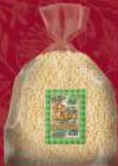
Презла 5кг. шифра: 843