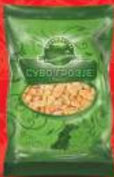
Суво грозђе бело 100г. 100/1 шифра: 43