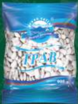
Грав 900г. 10/1 шифра: 11