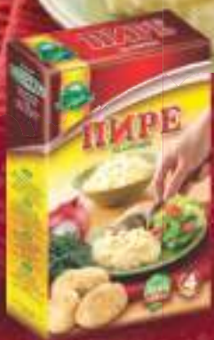
Пире 120г. 10/1 шифра: 33