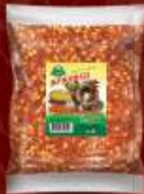
Буковец нелут 250г. 30/1 шифра: 148