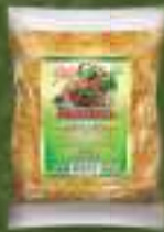
Наш зачин 200г. 20/1 шифра: 820