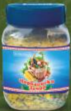
Чорбаџиски зачин 450g. 12/1 шифра: 151