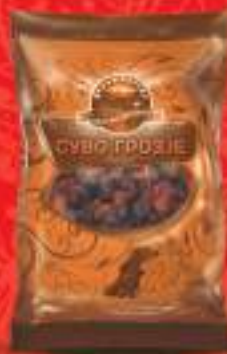
Суво грозђе црно 100г. 100/1 шифра: 44