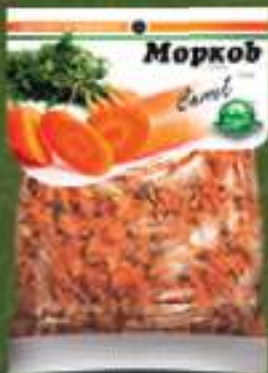
Морков сув 50г. 10/1 шифра: 25