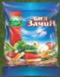
Бид зачин 100г. 50/1 шифра: