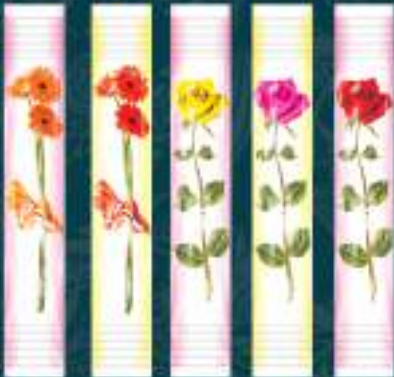
Шеќерче за угодителство 5г. 1/5 шифра: 51