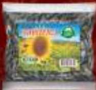
Сончоглед црн 40г. 50/1