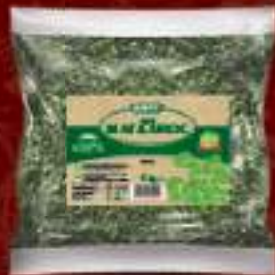
Магдонос сув 50g. 50/1 шифра: 24