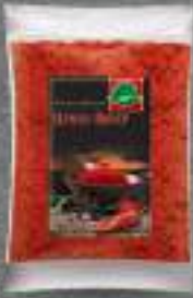
Црвен Пипер 250г. 30/1 шифра: 883