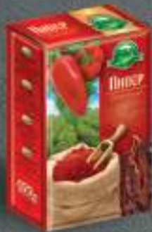
Додаток од Црвен Пипер 100г. 10/1 шифра: 46