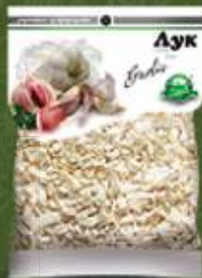
Лук сув 50г. 10/1 шифра: 23