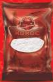
Кокос 100г. 50/1 шифра: 18