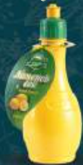
Лимонов сок 0,25л. 12/1 шифра: 467