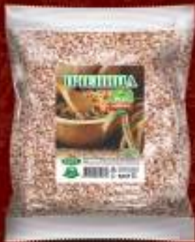
Пченица ЕКО 900г. 10/1