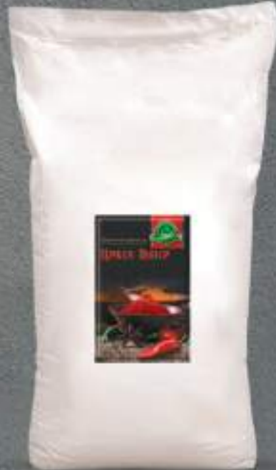
Црвен Пипер 25kg. шифра: 107