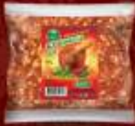
Буковец лут 60г. 100/1 шифра: 746