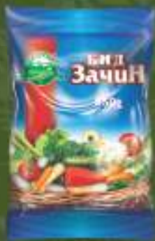
Бид зачин 250г. 50/1 шифра: 2