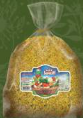
Бид зачин 10кг. кеса шифра: 5