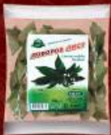
Ловоров лист 10g. 80/1 шифра: 22