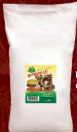
Буковец нелут 30kg. шифра: 685