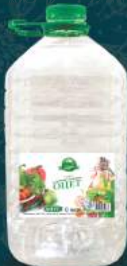
Оцет салатен 5л. 4/1 шифра: 422