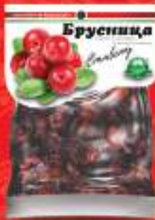
Брусница кандирана 100г. 10/1 шифра: 8