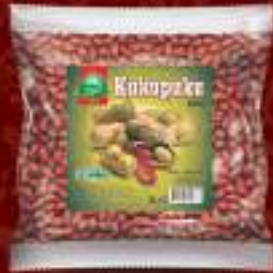
Кикирики 400г. 15/1 шифра: 16