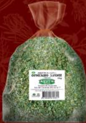
Оригано 1kg. шифра: 156