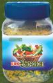
Бид зачин 900г. 9/1 шифра: 4