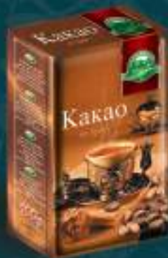
Какао 100г. 10/1 шифра: 15