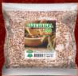
Пченица ЕКО 400г. 35/1 шифра: 36