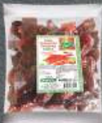
Блага сува пиперка 50г. 25/1 шифра: 1205