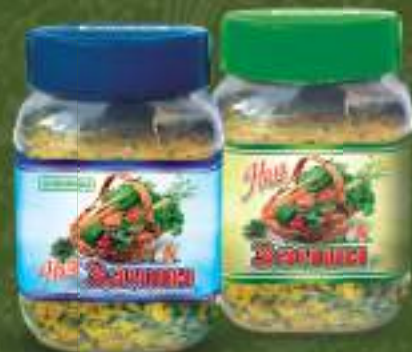
Наш зачин 900г. 9/1 шифра: 161