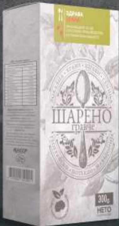
Шарено Гравче 300г. 10/1 шифра: 21