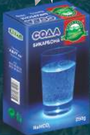
Сода Бикарбона 250г. 10/1 шифра: 40