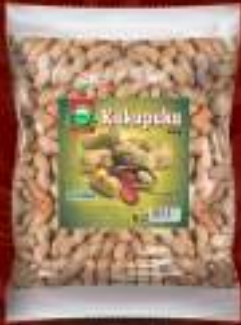
Кикирики (со мешунка) 400г. 10/1 шифра: 17