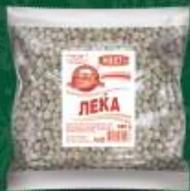
Леќа 400г. 10/1 шифра: 20