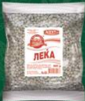
Леќа 900г. 10/1