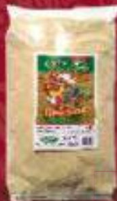
Презла 700г. 15/1 шифра: 441