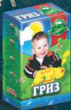
Гриз пченичен 200г. 10/1 шифра: 12