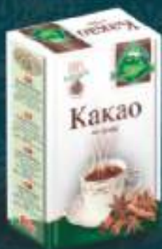
Какао 80г. 10/1 шифра: 14