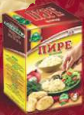
Пире 360г. 6/1 шифра: 37