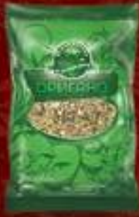
Оригано 50g. 80/1 шифра: 27