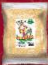
Презла 200г. 50/1 шифра: 146