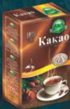
Какао 100г. натурално 10/1 шифра: 159