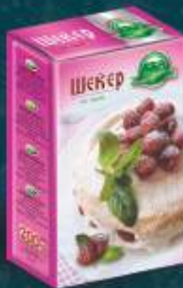
Шеќер во прав 200г. 10/1 шифра: 48