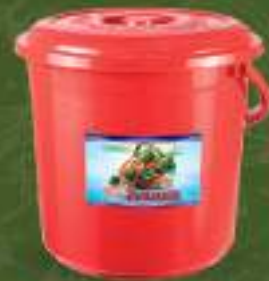
Наш зачин 10кг. кофа шифра: 153