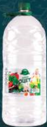
Оцет салатен 3л. 4/1 шифра: 414