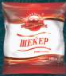
Шеќер 400г. 10/1